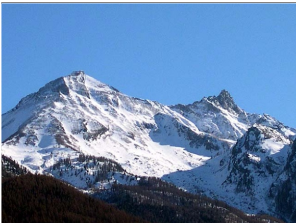
- Punta Mesdi ed Orsiera

Per avere maggiori informazioni o se volete farvi accompagnare nell'ascensione : www.altox.it