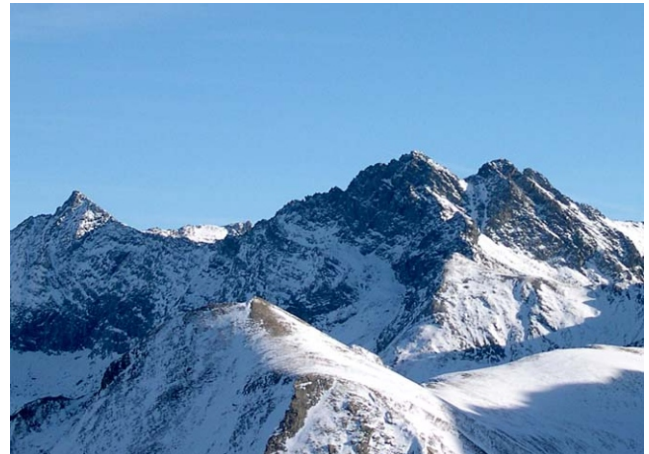
- Punta Rocca Nera ed Orsiera